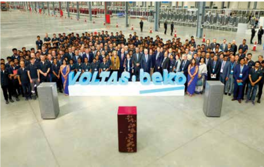
Arçelik ve TATA ortaklığıyla Hindistan'da kurulan Beko Voltas Şirketi, son yıllardaki önemli yurt dışı yatırımlarından biri oldu.