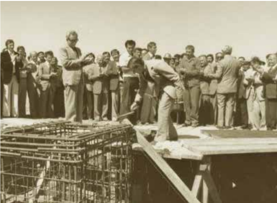
1959 yılında Otosan A.Ş'nin kuruluşu ve Ford Otosan Fabrikası'nın temellerinin atılması, önemli bir kilometre taşıydı.

"İşe başlayıp biraz para kazandıktan sonra mahalleimde, çarşımda, halk arasında muhtaç olanlara yardım etmekten büyük zevk almaya başladım. İsrraftan her zaman kaçındım. Boş yere yanan elektrik, akan su, gereksiz kullanılan bir araba için daima mücadele ettim, fakat hayır işlerine giden ve yerine giden parayı harcamaktan zevk duydum."