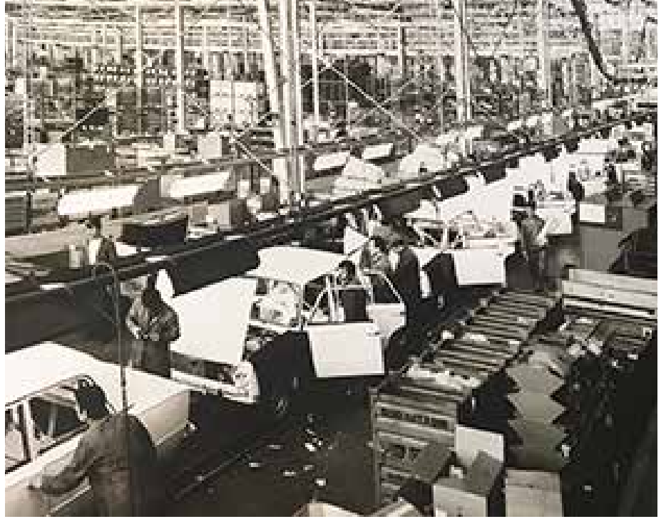
1968'de kurulan Tofaş Türk Otomobil Fabrikası, ilk çelik gövdeli Türk otomobili Murat 124'ü yarattı.

Ekonomik zorluklar, petrol krizi, döviz darboğazı ve siyasi krizlerin damga vurduğu 70'li yıllarda Koç Topluluğu bütün bunlara rağmen yatırımlarını sürdürmeye devam eder. Bu dönemde, Topluluk giderek büyür ve Koç ailesinin bireyleri, bu devasa yapı içerisinde etkin biçimde görev alır. Vehbi Koç, anılarında bu dönemden bahsederken şunları söyler: "Sanayiciliğe başlarken, daha