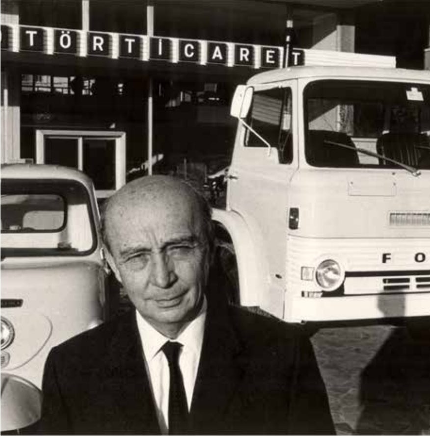
İkinci Dünya Savaşı döneminde, ilk otomobil satış şirketi Motör Ltd. Şti. 1944 yılında faaliyete geçti.

"Bu savaşı Amerika ve Müttefikler kazanacak, ticaret serbest olacak. Avrupa bitkin bir hâlde, Amerika'yla büyük işler yapmak için imkânlar çıkacak. İş alanıma giren büyük Amerikan firmalarının temsilciliklerini almalıyım."